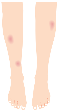
「結節性紅斑」は、ひざから下にできやすく、さわることでこりこりのような硬さがあります。

ひざ下などに痛い皮疹。急性の場合は4、5 ができる結節性紅斑につ 週間、慢性の場合は数カ いて、日本皮膚科学会認 月続くこともありす 定皮膚科専門医、中野皮 ー原因は？ 膚科クリニック院長の松 ー皮下脂肪組織の炎症 尾光馬先生に聞きました、全身性の疾患に伴っ た。 て発症することが多いよ ーどんな症状ですか？ うです。全体の2割を占